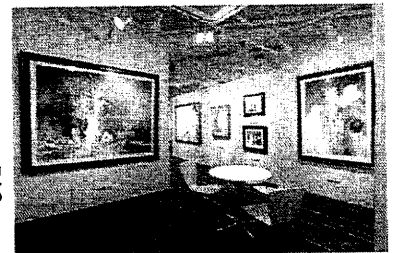
(銀座アートのスペース)

希望者には展覧会に出品できるレベルまで書道部会指導委員がアドバイスをいたします。